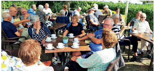
Op de koffie en de thee bij boscafé 't Rimpelt in Afferden

Sambeek, wat door het mooie weer afgeladen vol was met fietsers, ging de route verder naar ons eindpunt café Die Kneipe in Boxmeer. Daar lieten de fietsers zich onder meer het Duitse biertje van Zoller-Hof uit Sigmaringen goed smaken. Al met al een zeer geslaagde