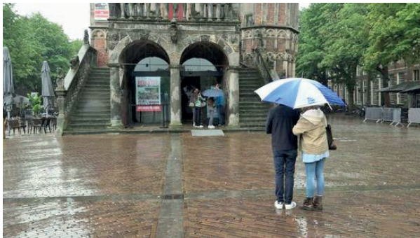
Een kletsnat Deventer. Zelfs het monumentale Waaggebouw probeerde zich schuil te houden

Aansluitend zijn we naar de stad Deventer gereden. We stapten uit in de regen. Dat was een rem voor ons om ver de stad in te gaan. Op het grote plein De Brink, met rondom veel terrassen onder luifels, zochten we 'onderdak' en een zitplaats