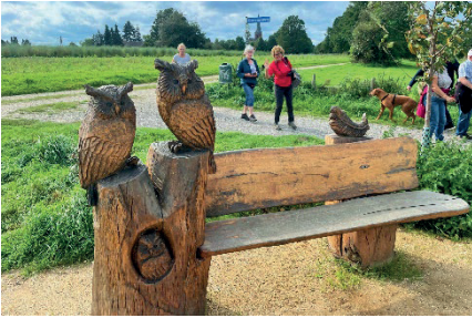
Een bankje voor de wandelaars. Met uilen die een oogje in het zeil houden

Anders dan in de uitgave van KBO-actief van september stond, zijn we deze keer voor onze maandelijkse wandeling naar het Duitse Kessel geweest, net over de