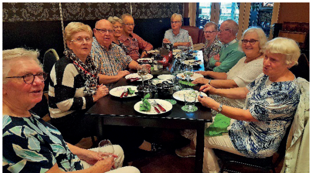
En dan nagenieten van een heerlijke maaltijd