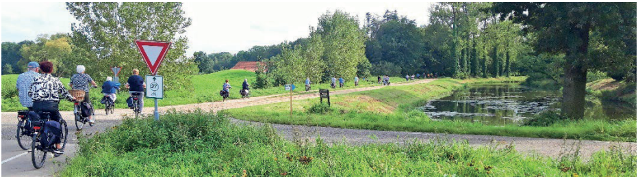
In een lange sliert door de omgeving van Landgoed Bleijenbeek

over de Maasbrug naar Gennep en via een rustige weg langs de Maas naar Afferden. Bij 't Rimpelt in Afferden was de stop voor de welverdiende koffie en thee. We hebben met z'n allen heerlijk buiten op het terras gezeten. Na de