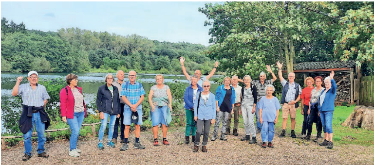
Wandelen zorgt voor goeie zin. De foto bewijst het duidelijk