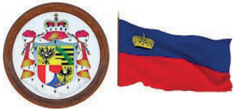
Het wapen en de vlag van het Vorstendom Liechtenstein, het dwergstaatje tussen Zwitserland en Oostenrijk