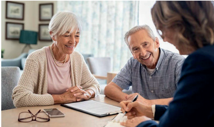
De ouderenadviseur, een belangrijke dienst van WOB

docenten maar ook zonder docenten; ik denk dat we elke week wel zo'n duizend ouderen op de been hebben, die deelnemen aan activiteiten. In alle kerkdorpen.