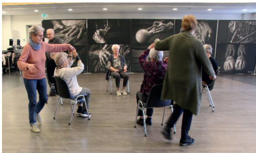
Zitdansen bij Welzijn Ouderen Boxmeer

Ontmoetingsactiviteiten (kaarten – kienen)