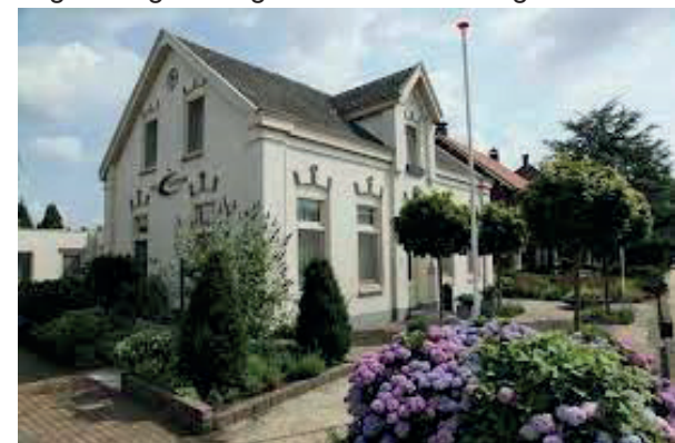
Hospice De Cocon in Sint Anthonis

Mensen die ernstig ziek zijn en in de laatste fase van het leven zijn, willen het liefst de tijd doorbrengen in een eigen huiselijke omgeving. Het kan zijn dat de zorg en begeleiding voor de mantelzorgers te intensief wordt. Dan zijn er toch