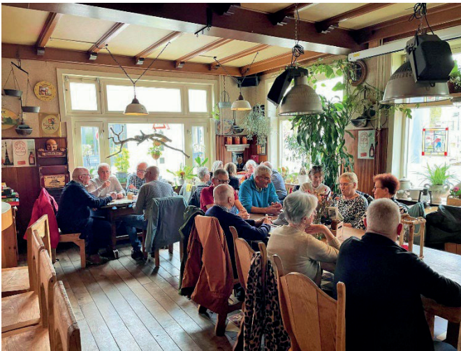
Terug in de tijd in Herberg Thijssen

Het is een gezellig bruin café en staat bekend bij veel Pieterpad-lopers, die hier een welverdiende pauze houden en ook kunnen overnachten. De herberg is nog geheel in oude stijl zoals 50 jaar geleden, prachtig om te zien. Na de koffie/thee-pauze ging de route verder langs de Maas door het Maasheggegebied. In de verte kwamen de dreigende wolken ons al tegemoet en jawel hoor, de regen en hagel