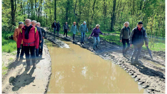
Even om de nattigheid heen

weer een gezellige boel onder de wandelaars. De route ging het meest over verharde wegen, maar soms ontkom je er niet aan dat je om een flinke plas water/modder heen moet, zoals op de foto te zien is. De route ging richting Vierlingsbeek via het buitengebied. Onderweg stonden drie alpaca's ons al op te wachten om zich even door hun krullenbol te laten kroelen. De pauze was bij Herberg Thijssen, centraal gelegen bij het dorpsplein.