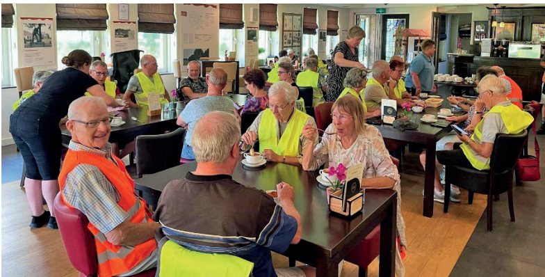
Aan de tomatensoep bij brasserie De Valkhoeve

langs Wanroij en door de omgeving van Wilbertoord naar recreatieplas De Kuilen bij Mill. De uitzetters van de mooie tocht hadden er duidelijk voor gezorgd dat de route niet dóór de dorpen ging, maar juist er omheen.